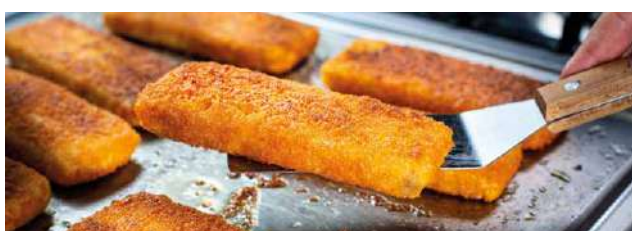
F1192A, Roślinna ryba panierowana, 100g