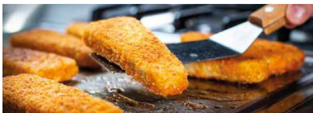
F1191A, Chrupiący filet roślinny, 75g